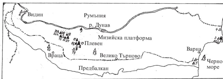
Фиг. 2. Залежи от нефт и природен газ в България

Нефтени и нефтогазови залежи (▲): 2 – Тюленово, 7 – Гиген, 8 – Долни Дъбник, 11 – Горни Дъбник, 14 – Долни Луковит, 15 – Писарово, 16 – Бърдарски геран, 17 – Долни Луковит – запад, 18 – Староселци, 24 – Селановци. Газови и газокондензатни залежи (△): 1 – Горен близнак, 3 – Тюленово, 4 – Крапец–Блатница, 5 – Долна Камчия, 6 – Гомотарци, 9 – Долни Дъбник, 10 – Чирен, 12 – Българево, 13 – Деветаки, 19 – Ъглен, 20 – Маринов геран, 21 – Бутан, 22 – Крива бара, 23 – Галата