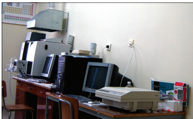
Фиг. 3. Новата лаборатория по AAS с генериране на пари, създадена по проекта BSEA.

действия. Проектът BSEA даде възможности за нови изследвания извън рамките на традиционните анализи и мониторинг на общите съдържания на токсичните елементи, насочени към модерното и перспективно направление „Специационен анализ“ (speciation analysis) [22], получаване на данни за някои недостатъчно изследвани токсични елементи (As, Cd, Cu, Hg, Ni, Pb) и техни токсикологично-значими химични видове и фракции [1,4,7,12,18], насочване към пробовземане около туристически обекти в края на активния туристически сезон (септември 2006 и 2007), изпитване на нови сорбенти за концентриране на следи от елементи от води с високо солево съдържание [2,3,5,6], вкл. на основата на селективни йонно-отпечатани полимери (ИП) за Hg(II) [5] и Cu(II) [2,10], въвеждане на нови методи за изпитване на място ( in situ, on-site ) [7], изследване на екоотоксичност спрямо морски алги при условия близки до естествените [4,7,14], отнасяне на данните към други параметри (съдържание на хранителни вещества, разтворена органична материя и др.) [4,7,14,18], разширяване на възможностите на методите с генериране на пари [1,4,5,8, 11-13] и др.