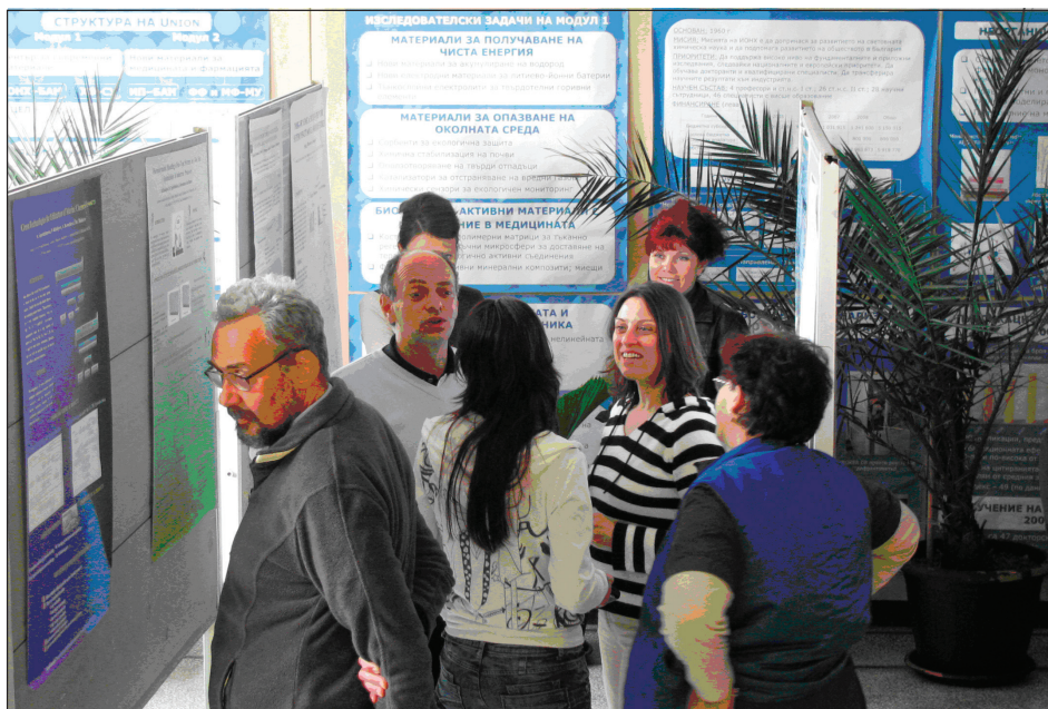
Фиг. 2. Постерите на младите учени, представени на Юбилейната научна сесия се радват на интерес.

– Неорганичното материалознание в ИОНХ – поглед от изминалите 50 години към бъдещето, от доц. д-р Е. Жечева;